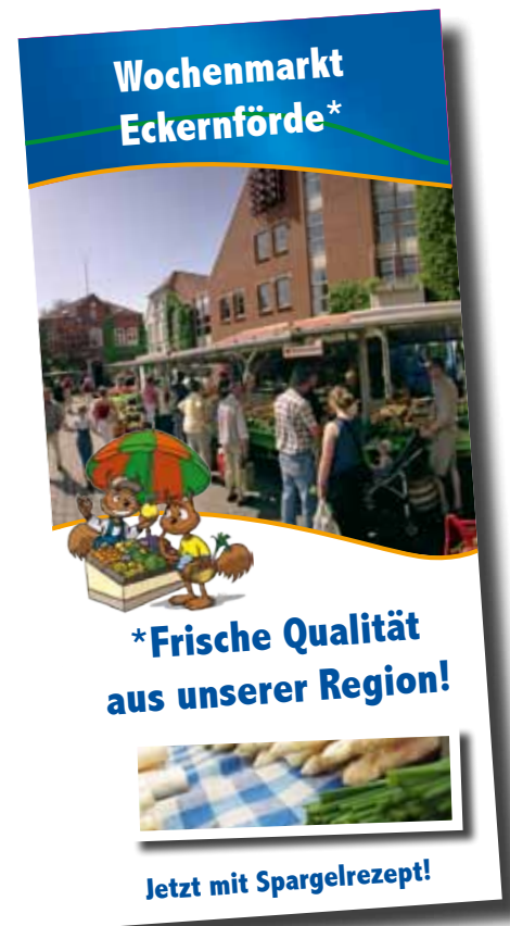
Neuer saisonaler Wochenmarktflyer

Der Wochenmarkt in Eckernförde strahlt Ruhe, Gemütlichkeit und Atmosphäre aus. Wochenmarkt - das bedeutet nicht nur reines Einkaufen, sondern auch schnacken und klönen. Wochenmärkte sind somit auch Treffpunkte und haben eine soziale Funktion. In vielen Orten Schleswig-Holsteins leiden die Wochenmärkte unter starken Umsatzeinbußen und Kundenrückgängen. In Eckernförde ist dies zum Glück noch nicht der Fall, ausruhen darf man sich allerdings auch nicht. Im Verbund mit dem Stadtmarketing Eckernförde wurde nun ein Jahresprogramm für den Wochenmarkt aufgestellt. Im Programm enthalten ist ein Mix aus Informationen und Unterhaltung. Der Auftakt wird mit dem Start einer Flyer-Serie gemacht. Der erste saisonale Flyer ist bereits an diesem Wochenende auf dem Markt zu bekommen. Sie finden in dem Flyer einen Plan des Wochenmarktes, so dass Sie sich gut orientieren können. Neben den Informationen zum allgemeinen Angebot, ist das saisonale Rezept das Highlight des Flyers. Möchten Sie Spargel in Sauce Hollandaise einmal selber machen? Dann nutzen Sie unser Rezept, die Zutaten erhalten Sie alle auf dem Wochenmarkt. Weitere saisonale Flyer werden folgen. Pro Jahr werden vier Flyer herausgegeben. Zusätzlich zu den Flyern wird es Veranstaltungen, Schaukochen und Themenmärkte geben. Wir halten Sie auf dem Laufenden.